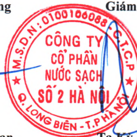
Tạ Kỳ Hưng