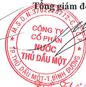
Trần Thế Hưng