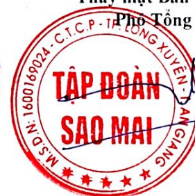
TRẦN BẢO ĐÔNG