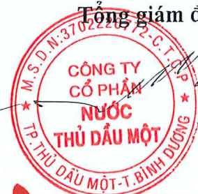
Trần Thế Hùng