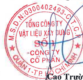
Cao Trường Thụ