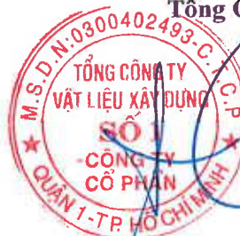
Cao Trường Thu