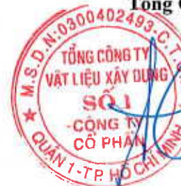
Cao Trường Thu