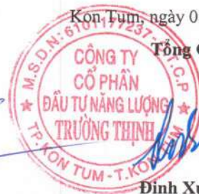
Đình Xuân Hoàng