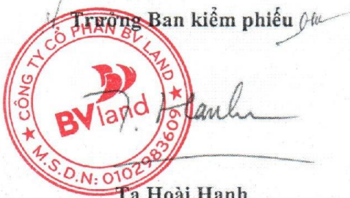
Tạ Hoài Hạnh Chủ tịch HĐQT