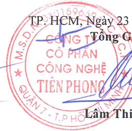
Lâm Thiệu Quân