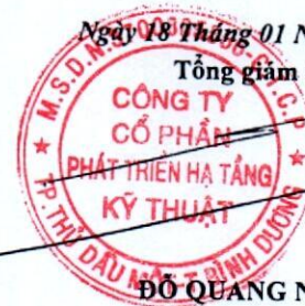
ĐỖ QUANG NGÔN