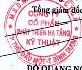
ĐỖ QUANG NGÔN