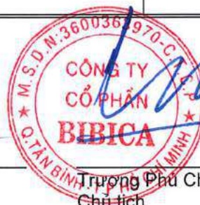
Trương Phú Chiến Chủ tịch