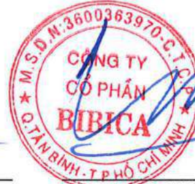
Trương Phú Chiến Chủ tịch