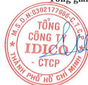
Đặng Chính Trung