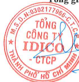
Đặng Chính Trung