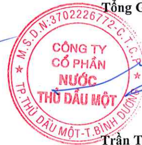
Trần Thế Hưng