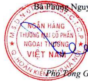
Phó Tổng Giám đốc