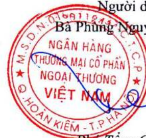
Phó Tổng Giám đốc