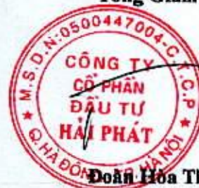
Đoàn Hòa Thuận