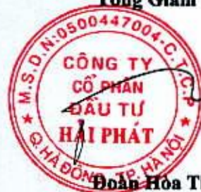
Đoàn Hòa Thuận