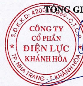
Nguyễn Cao Kỳ