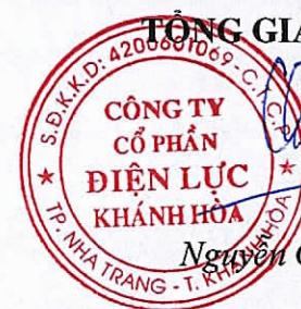
Nguyễn Cao Kỳ