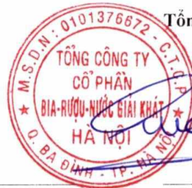
Ngô Quế Lâm