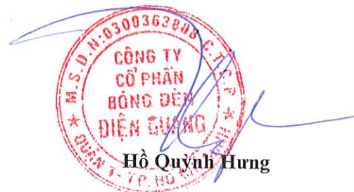
Hồ Quỳnh Hưng