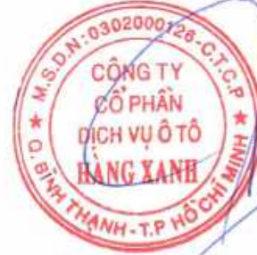
ĐỖ TIÊN DŨNG