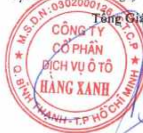
ĐỖ TIÊN DŨNG