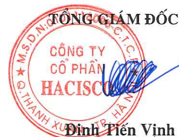
Đinh Tiên Vịnh