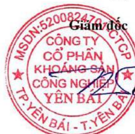
Huỳnh Song Trà