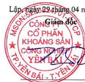
Huỳnh Song Trà