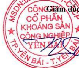
Huỳnh Song Trà