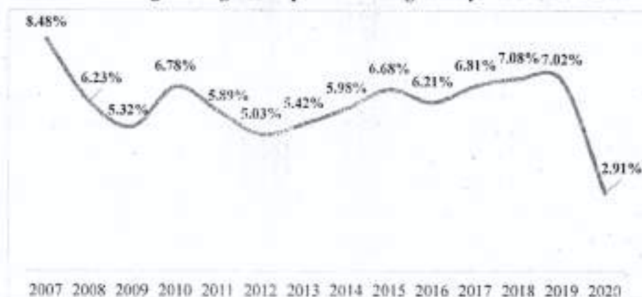
Hình 1: Tăng trưởng GDP qua các năm giai đoạn 2006 –2020