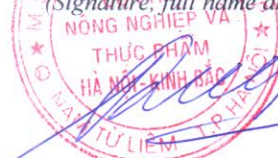
Dương Quang Lư

(Ký, ghi rõ họ tên, đóng dấu) (Signature, full name and seal)