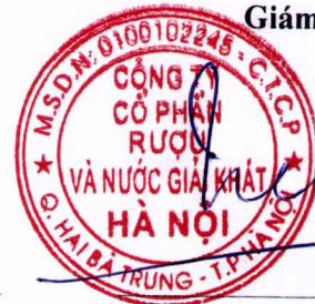
Trần Hậu Cường