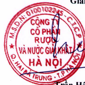
Trần Hậu Cường