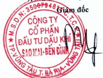
Phùng Như Dũng