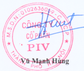
Vũ Mạnh Hùng

Các thuyết minh từ trang 07 đến trang 14 là một bộ phận hợp thành của Báo cáo tài chính này./.