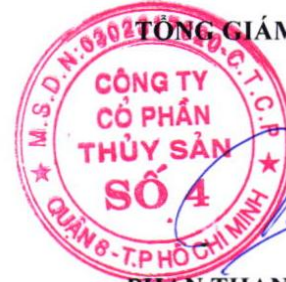
PHẦN THANH TÂM