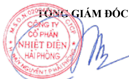
Dương Sơn Bá