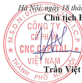
Trần Việt Hùng