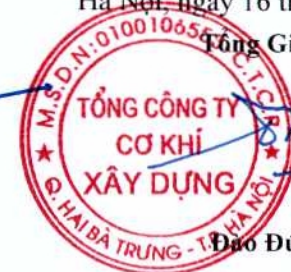
Đào Đức Thọ