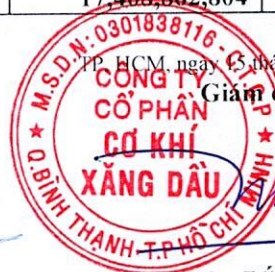
Đoàn Đắc Học