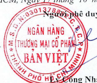
Công Nha GD Khối Tài chính kiêm Kế toán trưởng