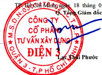
Lạc Thủy Phước