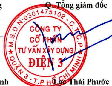
Ông Thái Phước