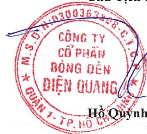
Hồ Quỳnh Hưng