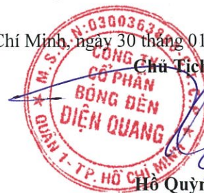
Hồ Quỳnh Hưng