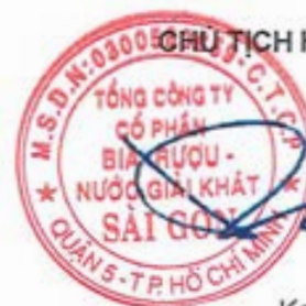
Koh Poh Tiong