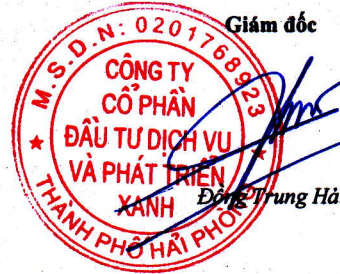
Đông Trung Hải