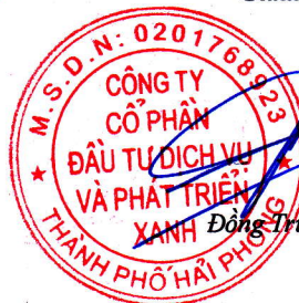
Đông Trung Hải