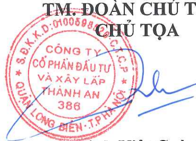
Trịnh Việt Cường