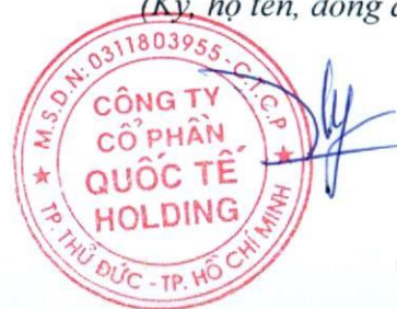
Đặng Thúy Vy