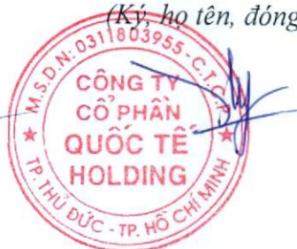
Đặng Thúy Vy