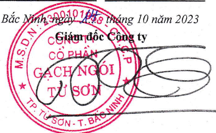
Trần Xuân Hùng