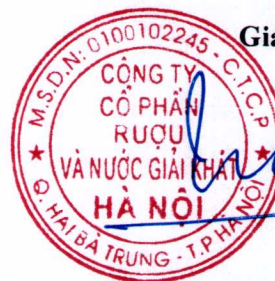
Trần Hậu Cường