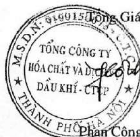
Phan Công Thành

Các thuyết minh đính kèm là bộ phận hợp thành của báo cáo tài chính riêng này