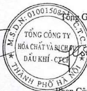
Phan Công Thành

Các thuyết minh đính kèm là bộ phận hợp thành của báo cáo tài chính hợp nhất này