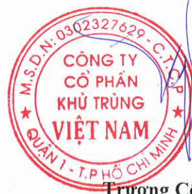
Trương Công Cừ