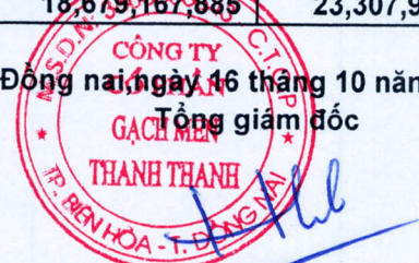
Trần Hưng Lương