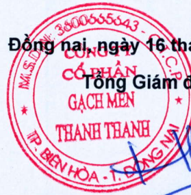
Trần Hưng Lương