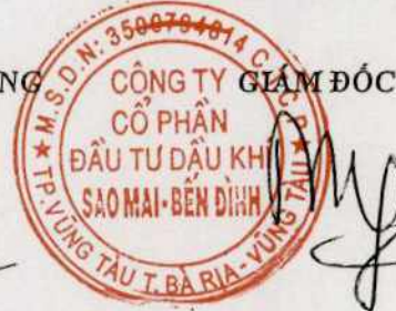
Phùng Như Dũng