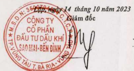
Phùng Như Dũng