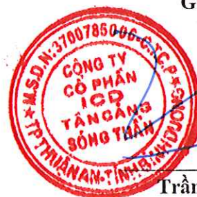
Trần Trí Dũng