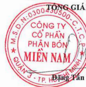
Đặng Tân Thành