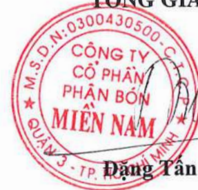
Đặng Tân Thành