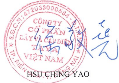
HSU CHING YAO