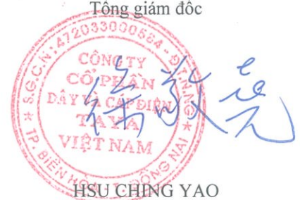
HSU CHING YAO