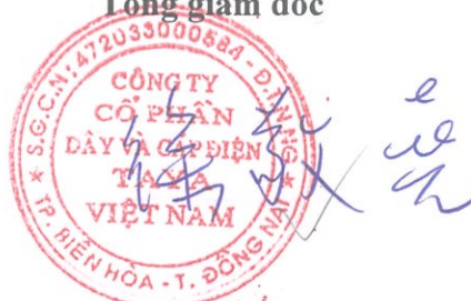
HSU CHING YAO