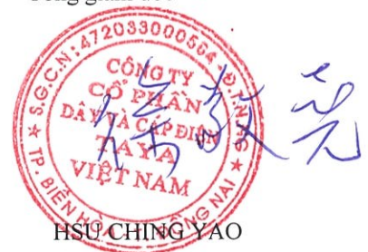
HSU CHING YAO