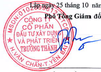
Trần Huyền Trang