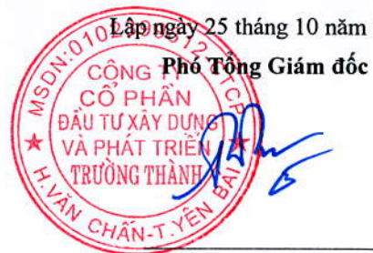
Trần Huyền Trang