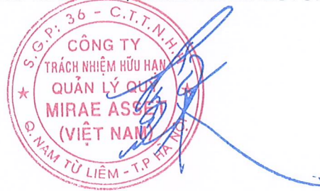
SOH JIN WOOK