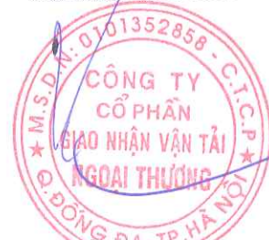
Trần Công Thành