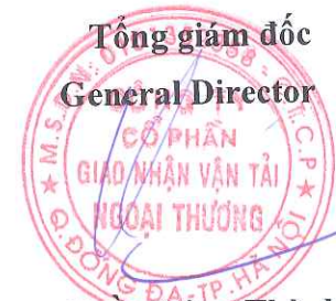
Trần Công Thành